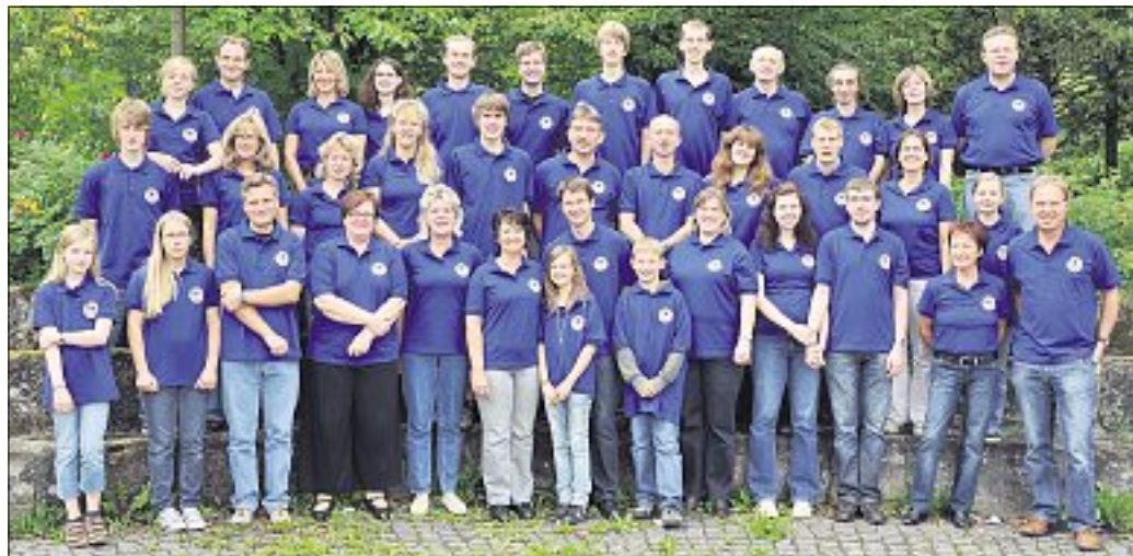
Die Kellerbühne: Schauspieler und Helfer freuen sich bereits auf den Sketchabend mit Loriots Klassikern.

am Planetenring beginnen an den Sonnabenden 12. und 19. November jeweils um 19.30 Uhr, an den Sonntagen 13. und 20. November jeweils um 17 Uhr.